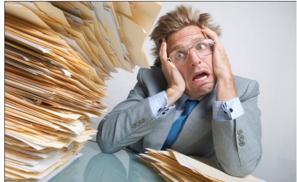
Abb. 1: Bürokratie mit absurden Ausmassen

Absurde Bürokratie mit einer Flut von Paragraphen und Verboten schränkt unsere Freiheit ein. Eigeninitiative und Unternehmertum werden behindert. Wir Liberalen wollen einfache Regeln sowie transparente und einfache Verfahren. Unnötige Verbote, Bevormundung, Bürokratie und die Beschwerdeflut sind uns ein Dorn im Auge. Statt immer neuer Gesetze einzuführen, sollten die bestehenden Gesetze konsequent durchgesetzt werden. Die FDP fordert: Absurde Bürokratie stoppen – aus Liebe zur Schweiz.